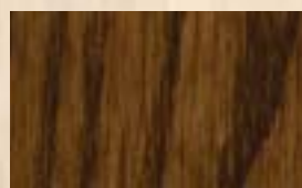
DEEP TINT Noyer 50g/L (*)