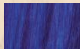
DEEP TINT Violet 40 g/L

(*) Disponible également en SKAR (teinte à l'eau prête à l'emploi).