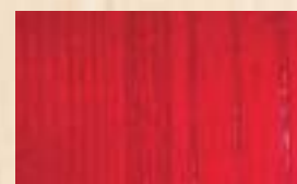
DEEP TINT Rouge croceine 30g/L