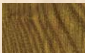
DELTA Chêne moyen 10g/L (*)