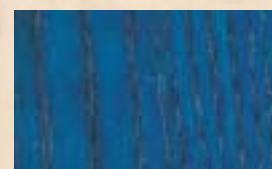
DEEP TINT Bleu roi 30g/L