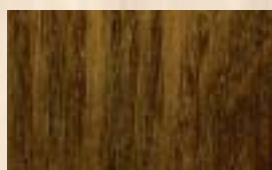
DELTA Chêne foncé 30g/L (*)