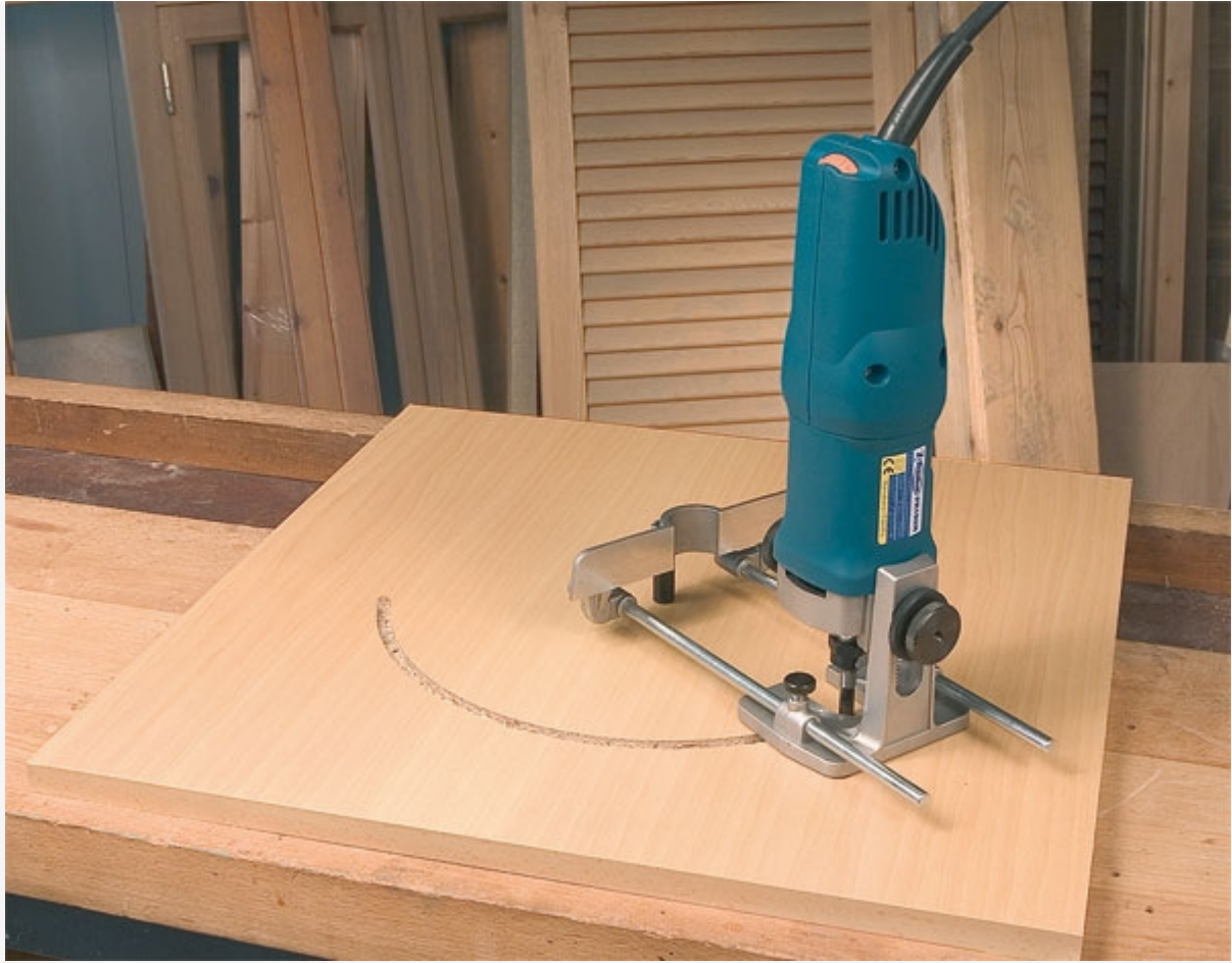
Fraisage de rainures circulaires.