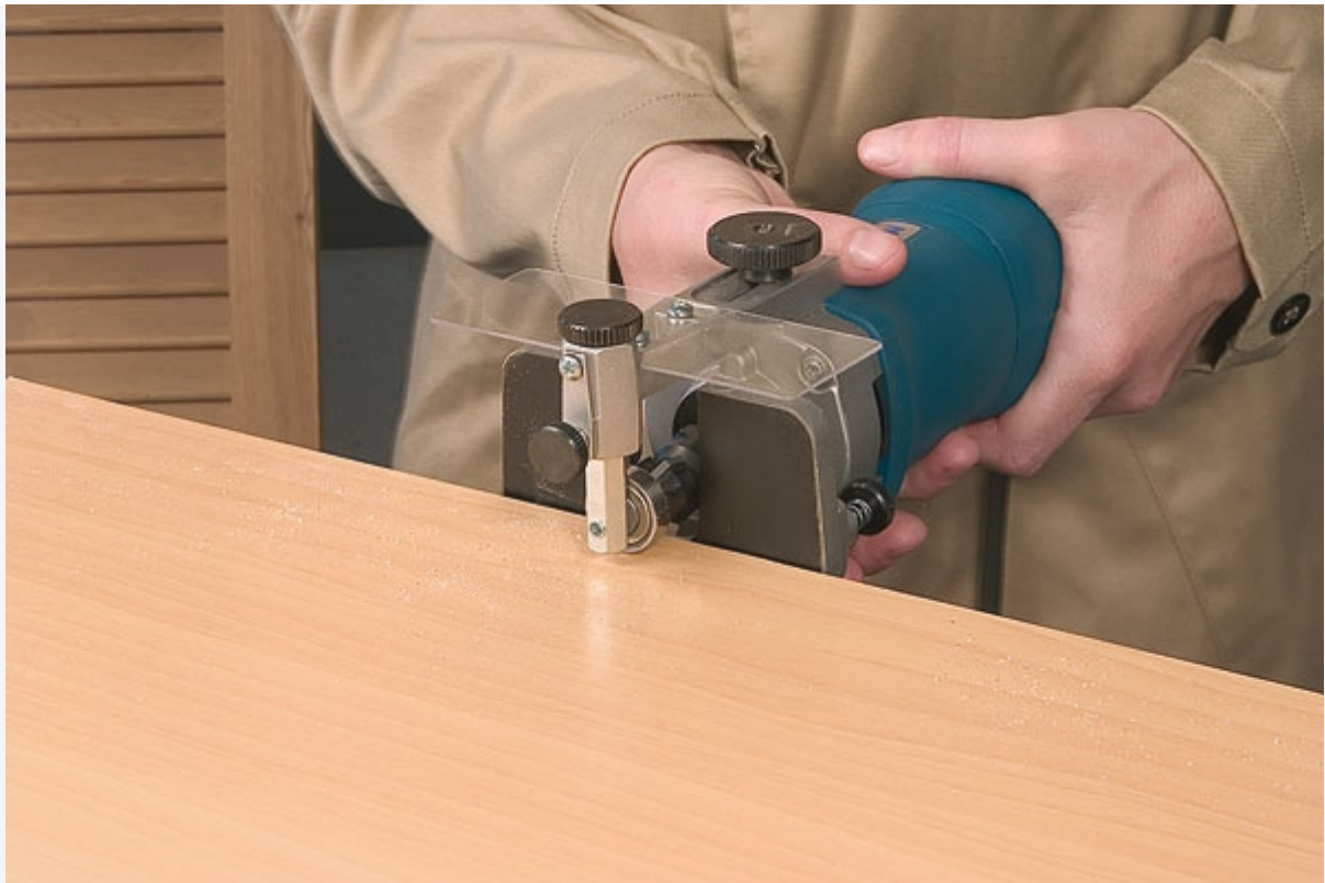
Affleurage de stratifiés.

Douilles de copiage: 1250001 Ø ext. 10 mm pour fraises de 6 mm 1250002 Ø ext. 12 mm pour fraises de 8 mm 1250003 Ø ext. 14 mm pour fraises de 10 mm 1250004 Ø ext. 16 mm pour fraises de 12 mm 1250025 Ø ext. 18 mm pour fraises de 14 mm 1250035 Ø ext. 20 mm pour fraises de 16 mm. Fraises professionnelles.