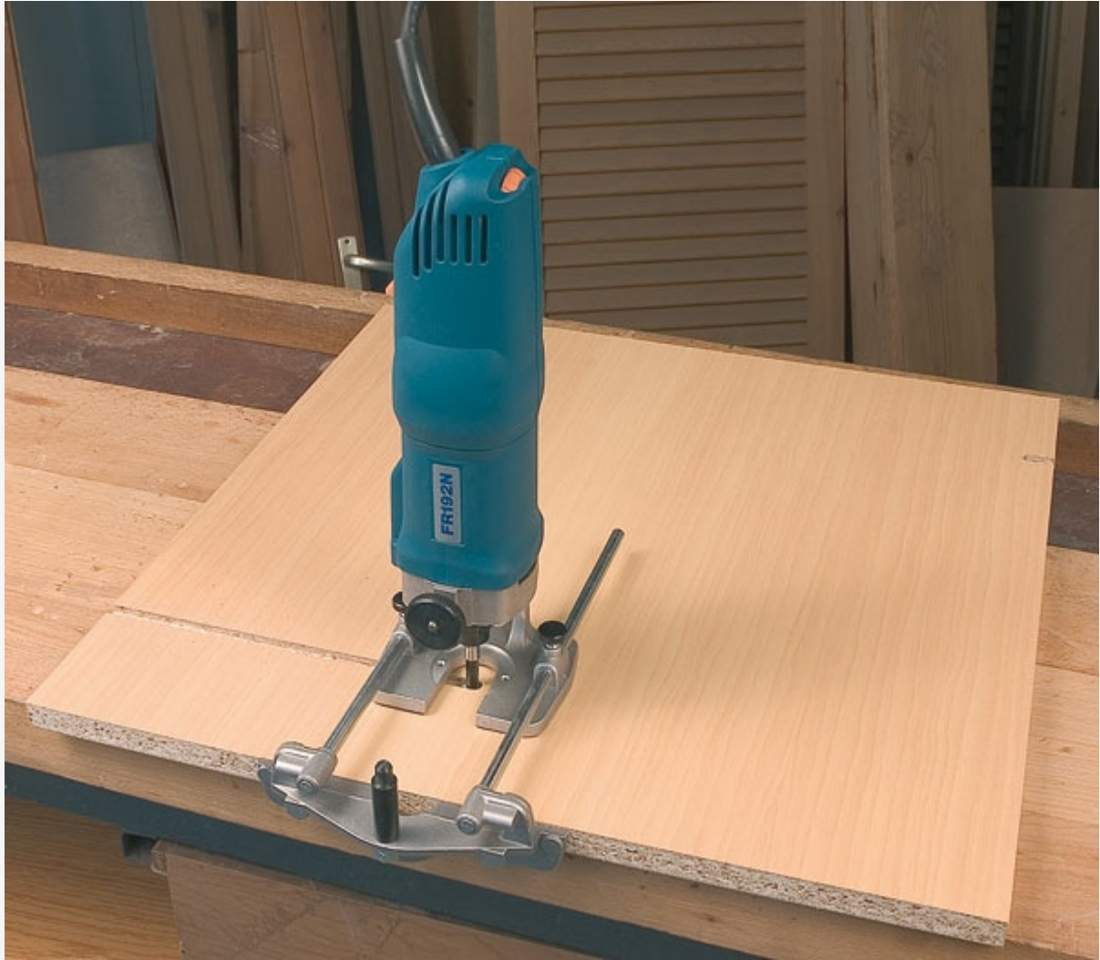
Fraisage de rainures parallèles avec le guide latéral.